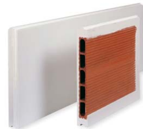
Bloque de Hormigón